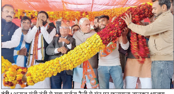
इंदी। अनाज मंडी इंदी में युवा गर्जना रैली में मंच पर फुलमाला डालकर भाजपा प्रदेशाध्यक्ष नायब सैनी का स्वागत करते आयोजक।