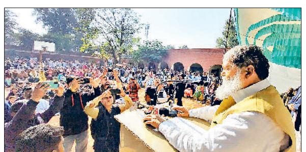
अंबाला। ग्रामीणों को संबोधित करते गृहमंत्री अनिल विज।

गरनाला पहुंची विकसित भारत संकल्प यात्रा, गृहमंत्री विज ने ग्रामीणों को किया संबोधित