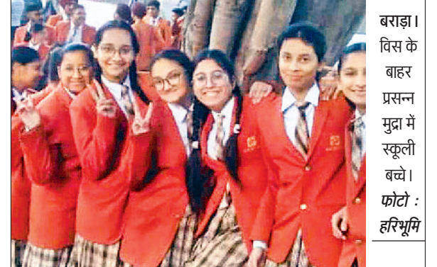
बराड़ा। विस के बाहर प्रसन्न मुद्रा में स्कूली बच्चे।

नर्देश दिए। उन्होंने इस मामले में कार्रवाई की रिपोर्ट तलब की तथा जांच नहीं करने वाले जांच अधिकारी पर भी कार्रवाई के निर्देश दिए। इस दौरान कबूतरबाजी के कई मामले आए जिन पर एसआईटी को मामले में कार्रवाई के निर्देश दिए गए। पहेवा की महिला ने बताया कि उसने अपने दो लड़कों को रोमांचिका भेजने के लिए एक एजेंट से बातचीत की थी। एजेंट को 10 लाख रुपये दिए थे।