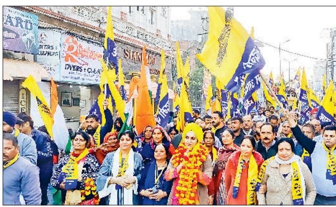
अंबाला। अंबाला छावनी के मुख्य बाजारों से होकर निकलती आम आदमी पार्टी की बदलाव यात्रा।