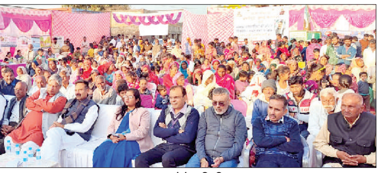
भारत विकसित संकल्प यात्रा के दौरान जनसंवाद करते विधायक व अन्य।