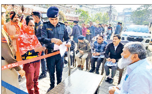
अंबाला। विभिन्न जिलों से आए लोगों की शिकायतें सुने गृहमंत्री अनिल विज।

गृह एवं स्वास्थ्य श्री अनिल विज ने शनिवार अपने आवास पर प्रदेश के जिलों से आए सैकड़ों लोगों की समस्याओं को सुनकर अधिकारियों को त्वरित कार्रवाई के आदेश दिए। हिसार से आए परिवार ने विज को बताया कि कुछ आरोपियों ने परिवार सदस्यों के साथ मारपीट की थी जिसके उपरांत उनके भाई की मौत हो गई थी। पुलिस ने हत्या का मामला तो दर्ज किया लेकिन अब तक कोई गिरफ्तार नहीं हुई। हत्या मामले में कार्रवाई नहीं होने पर